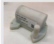
基於 LoRaWAN 技術的香港無線智慧水錶系統標準及其參考設計